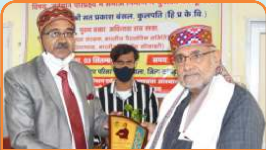
समाजकार्य विभाग द्वारा श्री अविनाश राय खन्ना जी, उपाध्यक्ष, रेड क्रॉस सोसाइटी ऑफ इंडिया एवं मुख्य संरक्षक, पैरालम्पिक समिति के विशिष्ट व्याख्यान का आयोजन