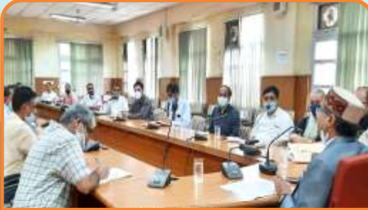
विश्वविद्यालय से संबंधित विभिन्न शैक्षिक एवं सह-शैक्षणिक मुद्दों पर अधिष्ठाताओं एवं विभागाध्यक्षों से गहन चर्चा