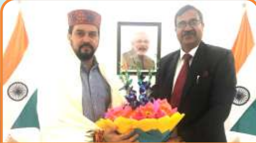
Hon'ble VC presents a bouquet to Shri Anurag Thakur Ji, Hon'ble Minister of Information & Broadcasting and Sports, youth Affairs