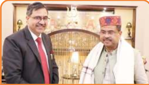
माननीय केंद्रीय शिक्षा मंत्री श्री धर्मेंद्र प्रधान जी से विश्वविद्यालय की भावी योजनाओं हेतु वार्ता एवं शिष्टाचार भेंट

Ph. : 01892-229330 | Email : vc@hpcu.ac.in