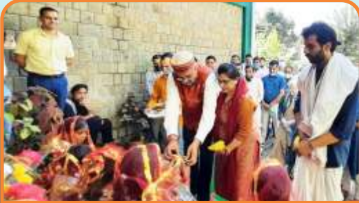
माननीय कुलपति महोदय द्वारा कुलपति सचिवालय में विद्या की अधिष्ठात्री देवी सरस्वती जी की प्रतिमा का नवरात्रों में प्रतिस्थापन