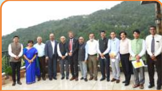
Members of Executive Council of CUHP