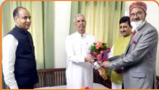
Hon'ble VC extends his best wishes to Shri Rajendra V. Arlekar Ji, Hon'ble Governor and Shri Jairam Thakur Ji, Hon'ble Chief Minister of Himachal Pradesh