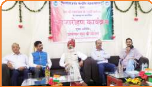
विश्वविद्यालय के धर्मशाला परिसर में आयोजित स्वतंत्रता दिवस समारोह में उपस्थित माननीय कुलपति महोदय एवं अन्य

Ph. : 01892-229330 | Email : vc@hpcu.ac.in