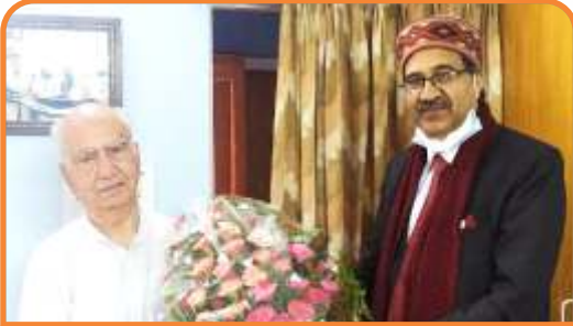
Hon'ble VC presents bouquet to Shri Shanta Kumar Ji, Former Chief Minister of Himachal Pradesh as a token of respect

Ph. : 01892-229330 | Email : vc@hpcu.ac.in