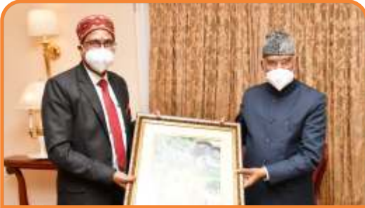
A formal greeting to Hon'ble President of India on behalf of CUHP

Ph. : 01892-229330 | Email : vc@hpcu.ac.in