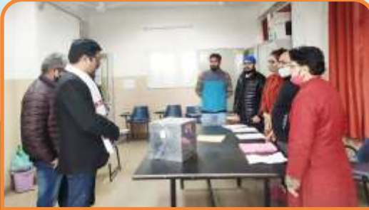
Successful Organization of Students' Council Election in CUHP in 2021